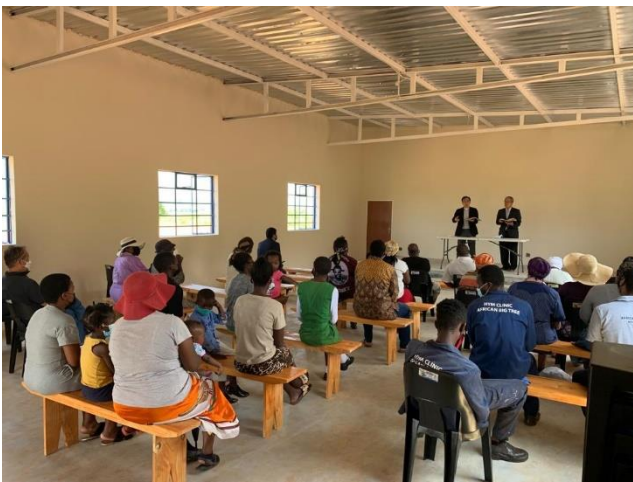
<지역주민과 함께 한 완공 감사예배>

3. 2021년 경운기를 기증한 농장에서 2022년 첫 쌀 수확이 있었습니다. 라이트한즈와 헌금해 주신 분들의 도움과 현지의 아프리카 빅 트리의 협력으로 구입해 전달한 경운기가 농장에서 여러 모로 잘 사용되고 있어 감사할 따름입니다.