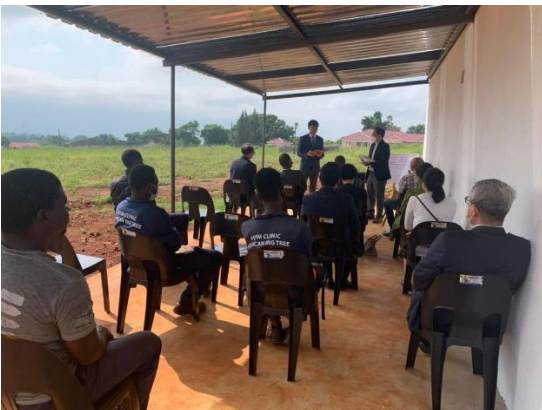
<HYM 병원 준공 감사 예배>

1. HYM 병원 (Hee Yeon Memorial Clinic 희연 기념 병원) 준공 예배를 드리고, 건축을 시작했습니다. 팬데믹과 에스와티니 왕국의 민주화 시위, 많은 비가 내리는 등 여러가지 도전들이 있어 미루어졌던 HYM 병원 준공 예배를 드리고, 벽을 쌓기 위한 벽 콘크리트 기초 공사와 콘크리트 바닥 기초 공사까지 마쳤습니다.