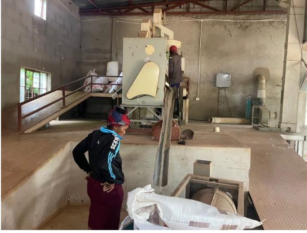
<수확을 마치고, 도정 중인 쌀>

4. 김승범 선교사가 프리토리아 대학교 신학부 박사 학위 (Ph.D)를 받았습니다. 2017년 신학석사를 시작으로 2018년부터 시작한 조직신학 박사 학위 과정을 하나님의 은혜로 마치게 되었습니다.