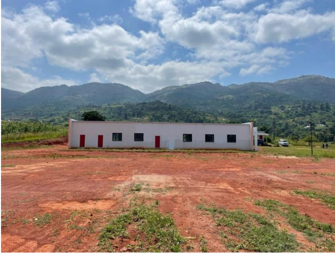
<만나 교육관 전경>